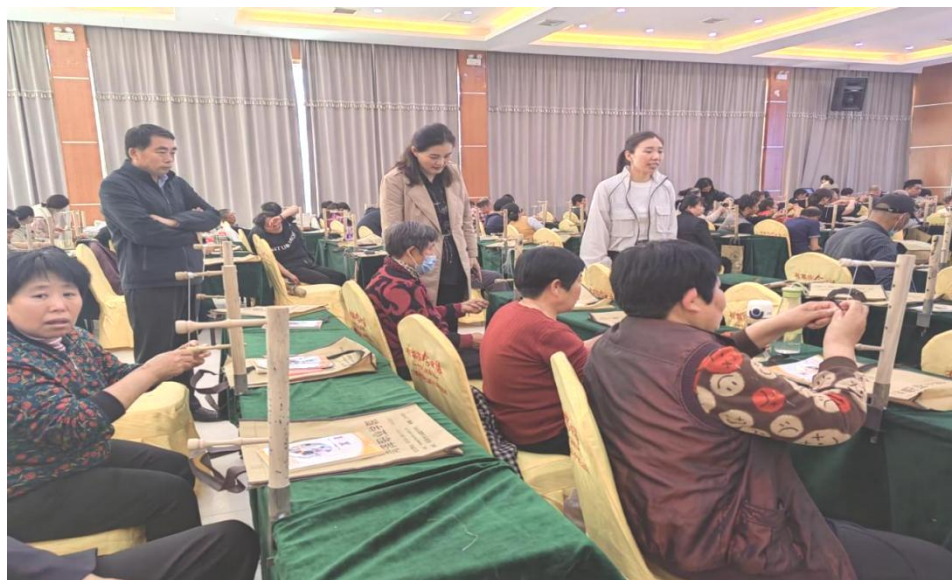
图 24：残疾人实用技术培训班教师对学员进行技能培训

跟踪回访等服务。培训班聚焦残疾群众所需所盼，大力开展困难残疾人实用技术培训，帮助困难残疾人掌握实用技术技能，增强残疾人自我发展能力，助力增收致富。