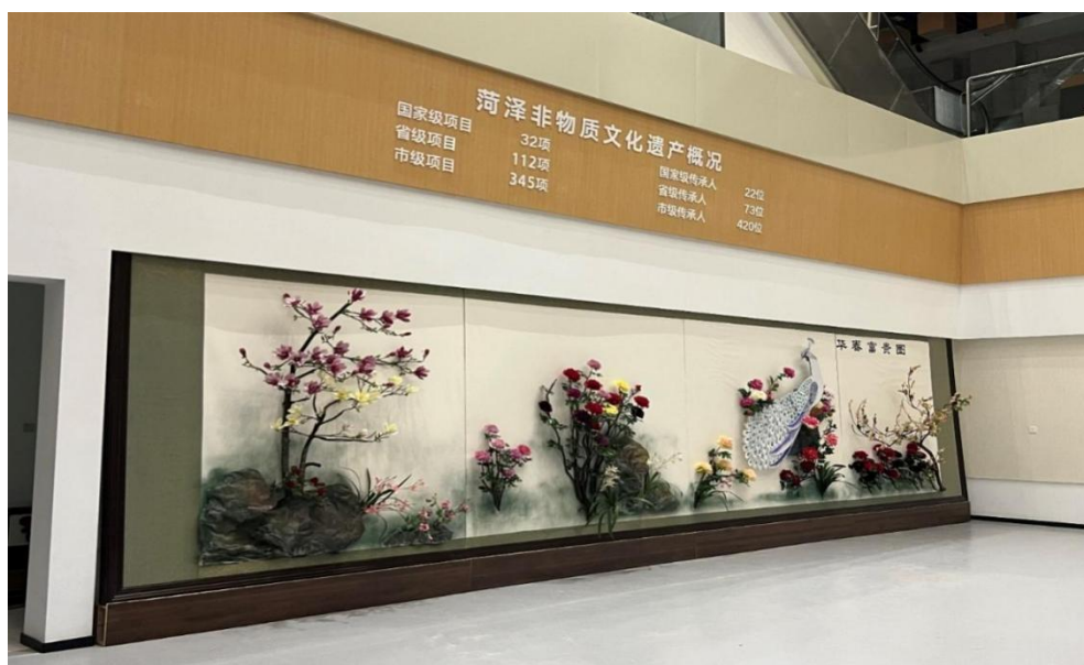
图 31：大学科技园菏泽非物质文化遗产概况