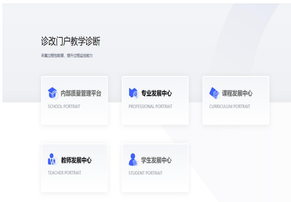
图 49：菏泽职业学院内部质量保证系统

不断完善内部质量保证体系建设与运行，持续健全“五纵五横一平台”内部质量保证体系，顺利通过山东省高等职业院校内部质量保证体系诊断与改进复核。