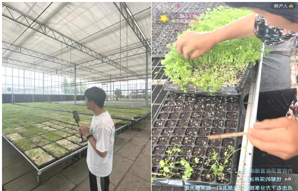
图 13：学生在大棚帮农民直播带货

商贸物流系（网络直播学院）“笃行致远队”前往山东省巨野县杨邢庄村开展电商助农社会实践活动，志愿者们逐一参观了玻璃温室大棚、常温育苗大棚等 10 个场地，充分了解了育苗大棚的结构、育苗方式、种苗品类以及月产量销量等等，同时也了解到该育苗基地目前主要是线下销售，销售对象也都是周边城区的农民或者生态园，存在销售方式落后，销量低的情况。在做好充分调研的前提下，学生走进大棚面对镜头，利用专业知识，当起种苗代言人，带领网友们了解育苗过程和育苗环境，通过互动和近距离展示让大家感受种苗的品质，进而根据个人需求进行选购。学生满怀热情，经过连续几天的直播，取得了观看人次总计五万，成交额突破万元的佳绩。