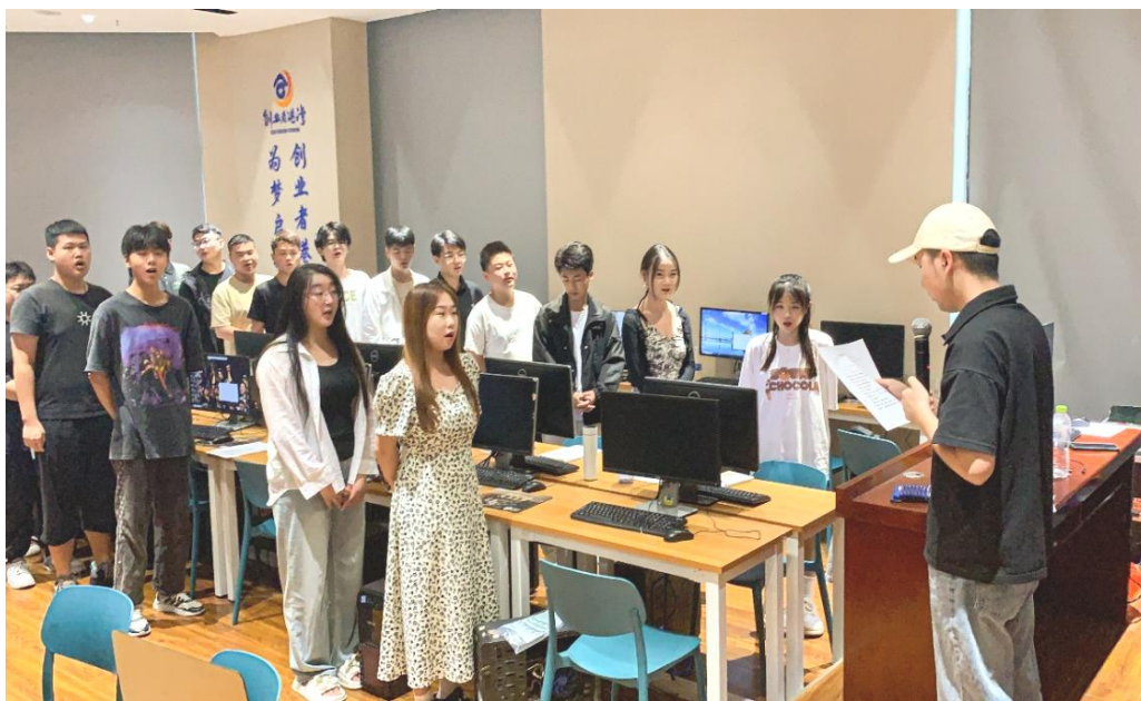
图 42：2021 级学生在铂爵旅拍菏泽分公司进行工学结合

人才培养模式，把学校的人才培养方案与企业人才培养流程进行结合，初步形成具有特色的创新型人才培养方案。信息工程系与铂爵旅拍文化集团有限公司相结合，派送 86 名学生到铂爵旅拍菏泽分公司进行工学结合，先进行了三个月的岗位学习和培训，然后到数码师岗位进行实践，86 名学生全部培训合格并上岗，企业反馈及学生反馈均良好。同时为使人才培养与用人单位有效对接，与企业共同探索更深入的合作方式——在 22 级计算机应用技术和动漫制作技术专业筹建企业冠名班，将企业课程纳入人才培养方案，以提高人才培养的针对性和学生实习就业的适应性。