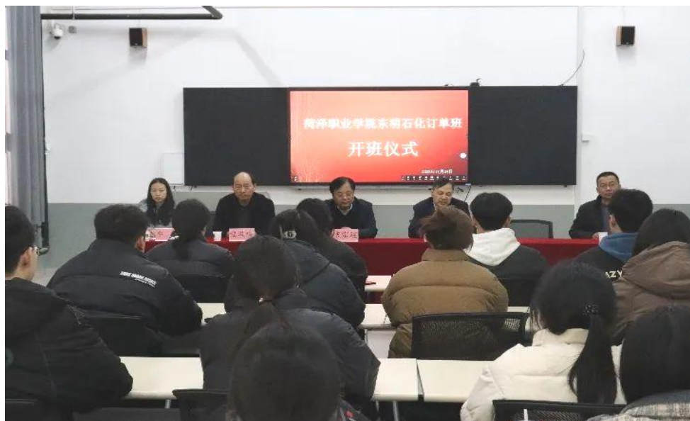
图 47：菏泽职业学院东明石化订单班开班仪式

（二）共建人才培养模式。在菏泽学院东明石化能源科技学院、菏泽职业学院东明石化订单班的基础上，联合体集聚资金、技术、人才、政策等要素在产业园区共建产教融合实训基地和产业学院，实行实体化运作，共商培养方案、共组教学团队、共享教学资源，共同实施专业课程开发、活页教材设计、学生实习实训、学业考核评价，探索化工高技能人才培养新模式。支持院校教师到东明石化生产一线顶岗实践、挂职锻炼，一方面学以致用，推进企业生产技能和流程再造，另一方面将企业新工艺新技能新规范学习吸纳，充实到教学内容中，建立起联合培养双师型教师的机制。支持东明石化技术人员、管理人员、能工巧匠到院校实践教学，引企入校、引企入教。广泛开展校企联合招生、贯通培养、岗位成才的中国特色学徒制。