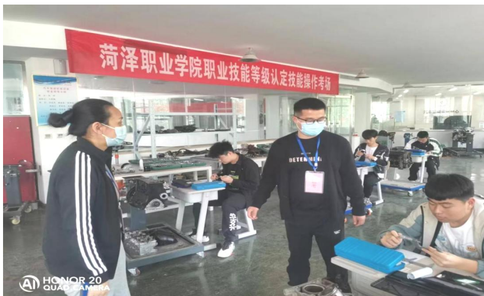
图 29：职业技能等级认定考试现场