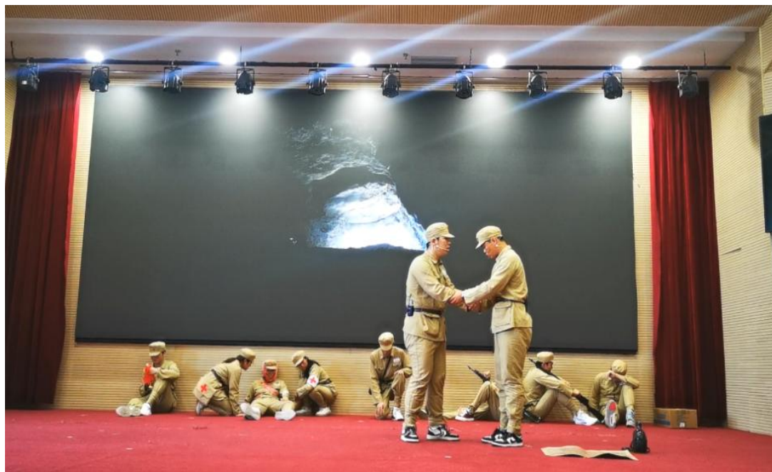
图 35：学生红色主题情景剧展演活动