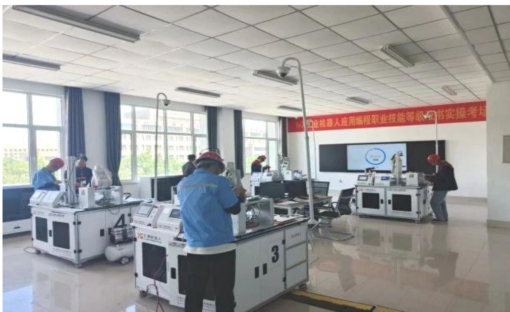
图 20：“1+X”工业机器人应用编程证书考试

深化“岗课赛证”融通育人机制，以满足地区经济社会发展需求为目标，以服务黄河流域生态保护和高质量发展为追求，持续优化人才培养方案，将新技术、新工艺、新理念纳入教材，将企业典型案例引入课程，将职业资格证书、职业技能等级证书内容融入教学。制定特色创新项目管理办法，统筹大赛、教学名师、教学创新团队、在线精品课程、教学改革研究项目和教学成果等特色创新项目的立项、培育、申报工作，营造全校大赛赛事氛围，落实以赛促教、以赛促改、以赛促学。遴选、优化 1+X 证书项目，抓好 1+X 证书和职业资格考务工作，推进课证融通落地落实，申报获批 1+X 证书试点 37 个，被评为“2022 年度 1+X 空中乘务职业技能等级证书全国优秀组织单位”和“2022 年度 1+X 空中乘务职业技能等级证书全国优秀考核站点”。2023 年毕业生证书获取比例 51.98%。