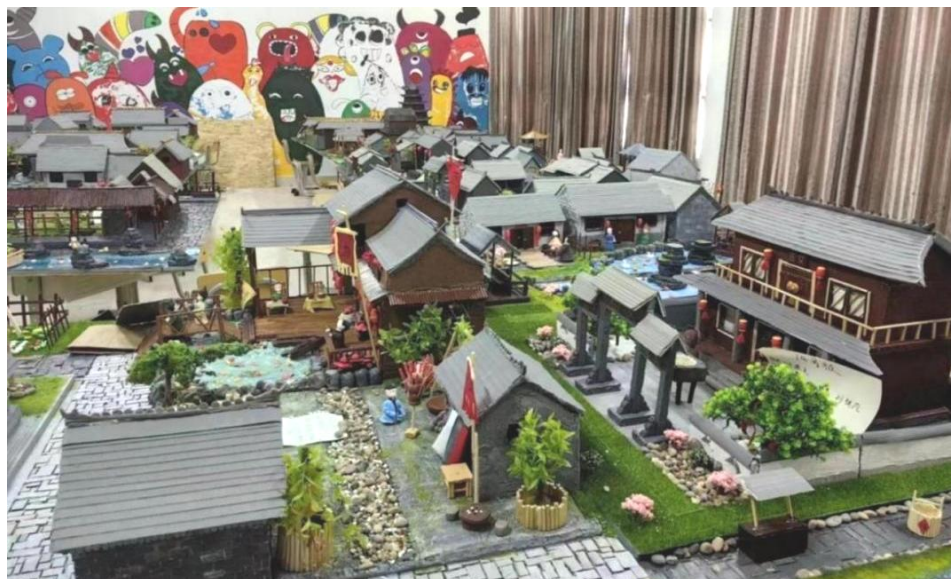
图 33：曹州古城手造部分作品