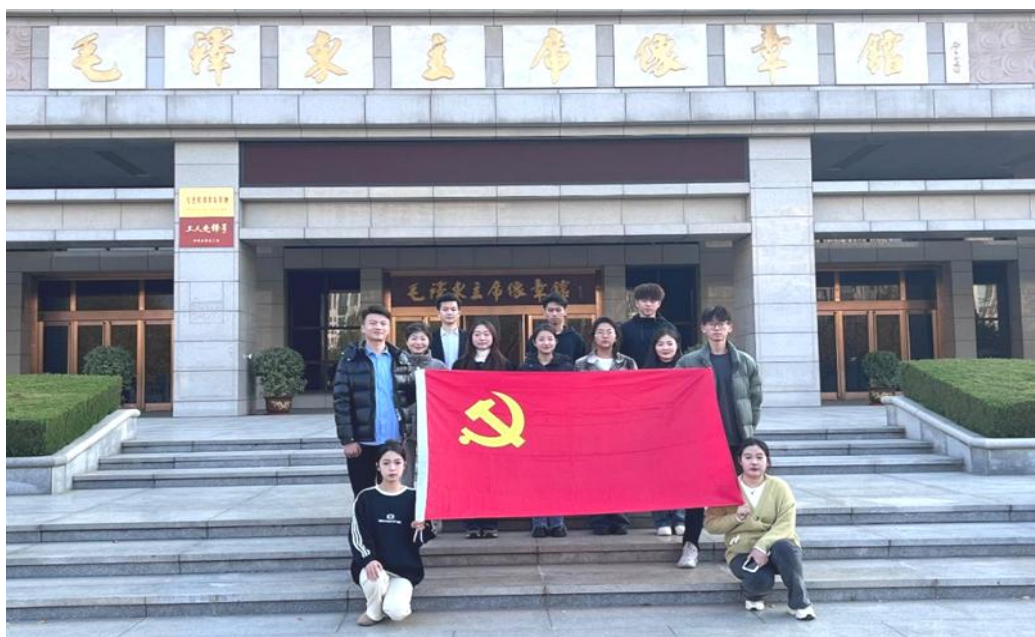
图 34：学生到红色教育基地参观学习

认识党的历史发展主线和本质，从重大历史事件、重要人物、重要讲话精神中汲取养分智慧和力量。探索红色足迹、牢记初心使命，以沂蒙山革命纪念馆、台儿庄大战遗址公园、羊山红色教育基地等省内红色教育基地，以及市内冀鲁豫边区革命纪念馆、“红三村”抗日联防遗址、湖西革命烈士陵园等为主，分批次组织开展“瞻仰红色教育基地，坚守育人初心使命”红色教育活动。围绕“五四”“七一”等重要节日，开展主题宣讲和大型文艺演出活动，回顾党的光辉历程，弘扬伟大建党精神，传播社会主义核心价值观。