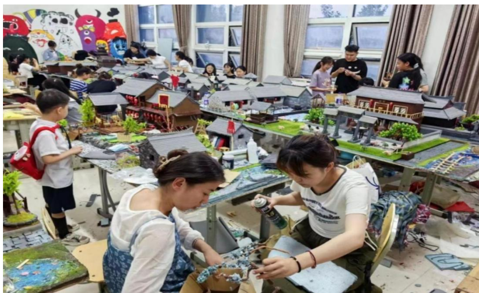
图 32：学生制作曹州古城手造场景