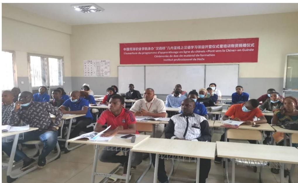
图 39：非洲几内亚学生上课图片

的中外人文交流模式，依托专业优势和平台优势，面向几内亚孔子学院的学生，以职业技能培训为主，多角度、全方位、立体化呈现中国的工业机器人制造技术；以汉语教学为辅，通过线上交流平台，持续向几内亚学生输出汉语拼音、奇妙的汉字等语言类课程，展示中国文化的独特魅力，同时将牡丹文化的传承与发扬融入课程。学校以此为契机，打造“一带一路，一路有花”具有菏泽特色的牡丹文化国际教育交流平台，树立优质职教国际化品牌，为非洲培养更多的现代化产业和职业教育发展亟需的高技能人才，为“中非命运共同体”建设作出贡献，推动更深层次、更宽领域、更全方位的国际交流与合作。