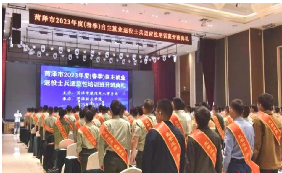
图 23：菏泽市退役士兵适应性培训开班仪式

向全市集中，整合培训规模，统一培训标准，全方位提升了培训质量。二是开发线上培训平台，努力做到适应性培训参训率百分百。学校开发了退役军人线上培训平台，做到线上线下相结合，对学员的学习情况进行实时监督，达到全员参与的目的。三是精准匹配环节，搭键就业桥梁，实现退役军人就业零距离。每期培训都举办成规模的现场企业推介会和招聘会，较好地实现了为退役军人提供高质量用工岗位的愿望，做到了退役军人就业、应聘“零距离”，在培训的同时直通就业。