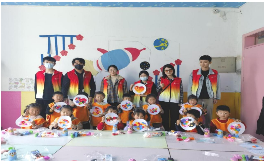
图 14：学生团队为乡村幼儿上红色美术特色支教课程

学前教育系“一朵小红花”志愿服务团队，为促进城乡教育资源的合理配置，提升农村教育水平，关爱乡村留守儿童，利用暑期开展社会实践活动，以实际行动为乡村教育贡献一份力量。在活动过程中发起公益募捐开展义卖活动筹集经费 10000 余元，为乡村学校捐赠教育用品等物资，通过送教入园为乡村留守儿童提供学习辅导、心理辅导等服务。通过此次社会活动，学生不仅帮助了留守儿童，促进了城乡教育的均衡发展，还提高了团队成员的综合素质以及社会责任感。