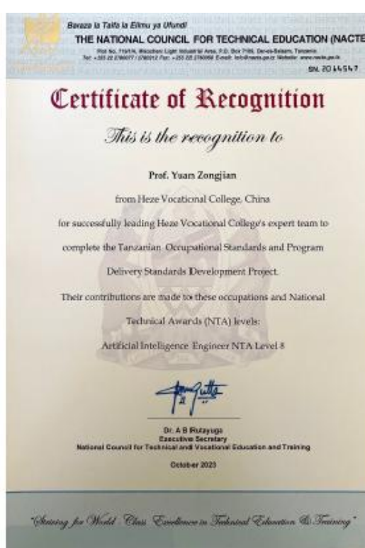
图 40. 国家职业标准校长证书