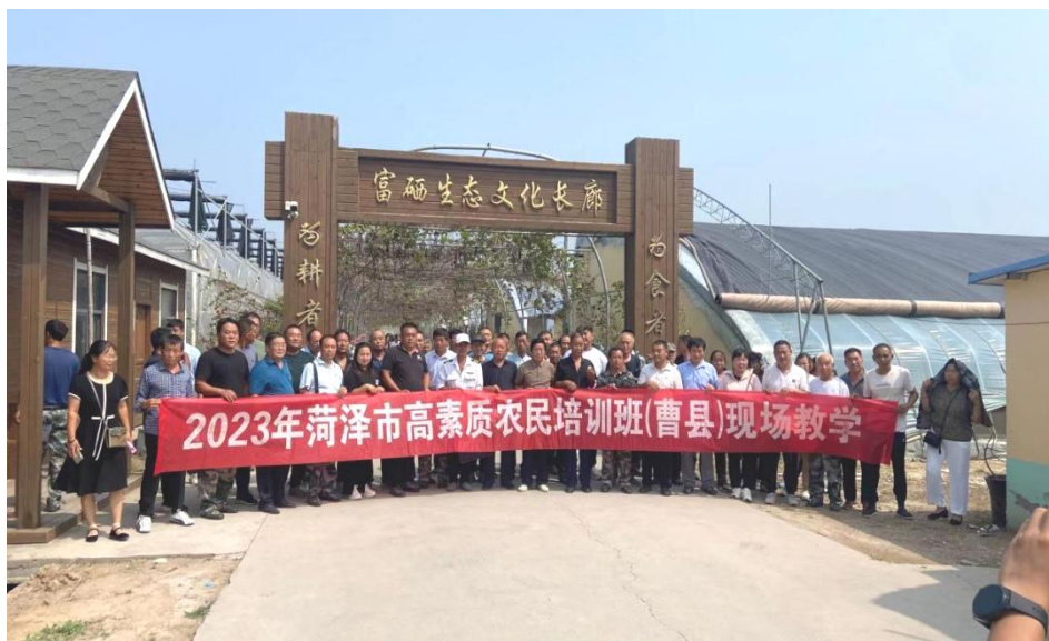
图 25： 菏泽市高素质农民培训班现场教学

菏泽职业学院作为省级新型职业农民培训基地，市乡村振兴局挂牌的“乡村振兴学院”，承担市县高素质农民培训 14 期共计 2179 人。突出强化党建引领作用，实行“支部建在班上”管理模式，坚持将党的领导贯穿始终。学员报到后，第一时间组织召开党员大会，选举产生临时党支部委员会，充分发挥支部战斗堡垒作用和党员先锋模范作用，临时党支部负责培训班日常管理和应急事项处理工作，使整个培训期间学习、生活、管理更有序、更规范、更高效。同时培训采取“田间课堂现场教学+分组互动研讨”相结合的方式，培训效果和质量大大提高，为菏泽市高素质农民经营管理高质量发展注入了新活力，为实施乡村振兴战略与巩固拓展脱贫攻坚提供全力支持。