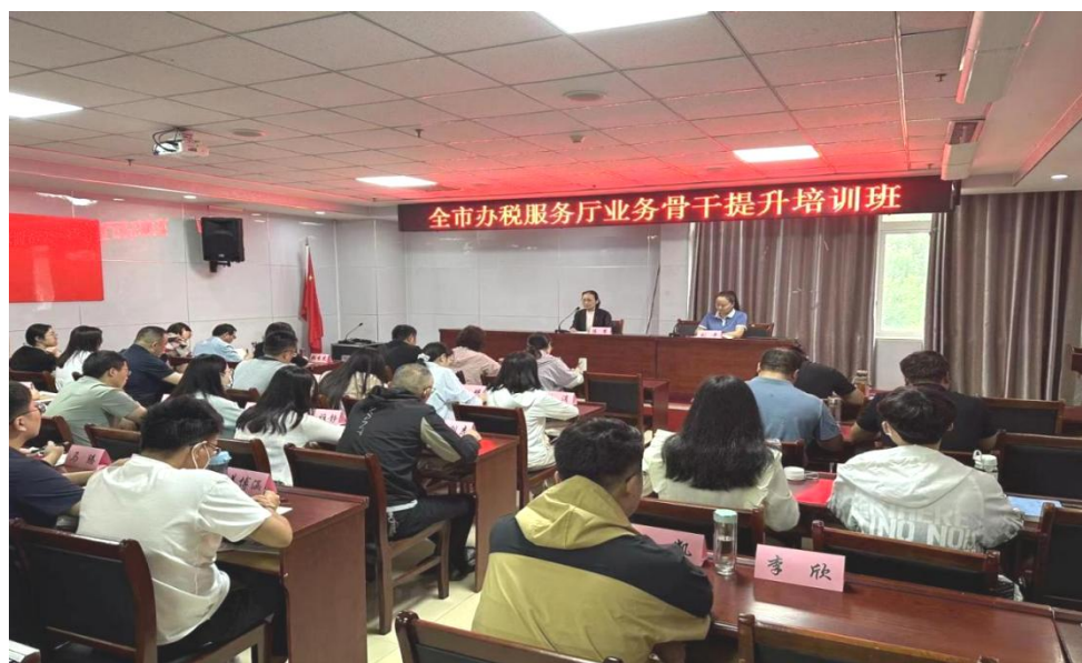
图 27：全市办税服务厅业务骨干提升培训班现场

办党政干部系列培训共计 420 人。承办了菏泽市市直行政事业单位财务财会培训班，来自市直部门单位财务负责人及业务骨干、各县区检察院、法院会计工作负责人等 260 人参加培训，进一步提升了会计人员专业能力和综合素质，更好地服务于全市经济社会高质量发展大局；开展了菏泽市投资审计工程造价培训班，重点开展建筑业审计业务培训，培训班为期 20 天，30 名审计干部参加培训，努力建设一支高素质的投资审计队伍，进一步提高了菏泽市投资审计工作高质量发展能力；开展了全市发改系统综合执法专题培训班，培训学员 34 人，提升了发改系统人员的综合执法水平、业务操作技能和业务办理水平，打造一支政治坚定、业务过硬、敢于担当、廉洁高效的一流执法队伍；开展了 2 期税务纳服干部培训，培训税务纳服干部 100 人，促进青年干部能力的提升，聚焦税收现代化，服务中国式现代化能力建设要求，加强青年税务干部的培养成长。