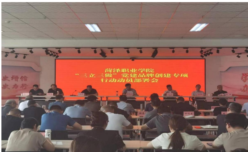
图 48：菏泽职业学院“三立三做”党建品牌创建专项行动动员部署会