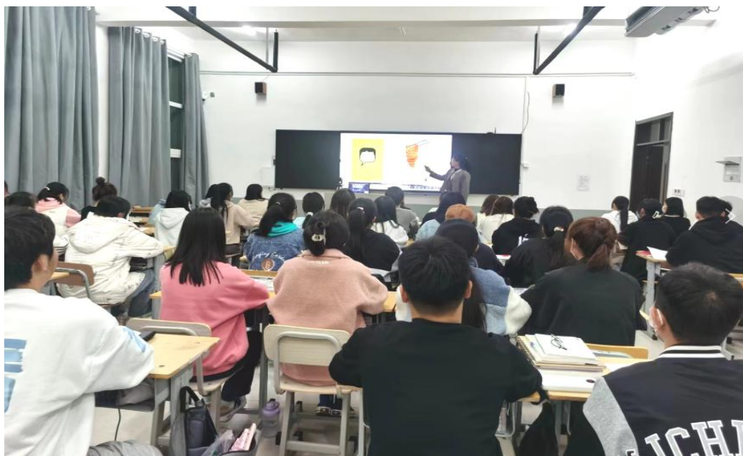
图 28： 学生在创新创业课中认真听讲