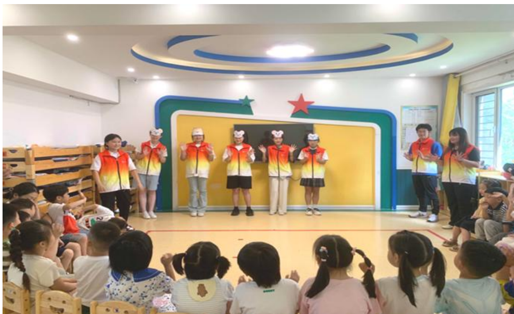
图 15：学生积极参与结对社区工作