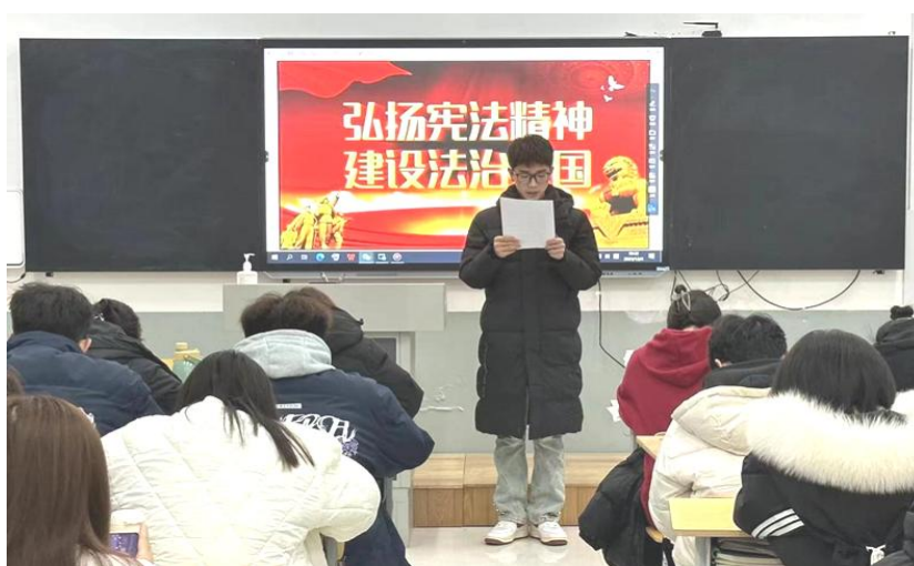
图 5：学生宪法宣传周系列活动

法治教育。 加强《思想道德与法治》公共基础课程建设，开设专业法律相关课程；组织开展“宪法卫士”活动，参与人数 9966 人，参与率达 97.9%；开展宪法宣传周系列活动，包括宪法宣誓、朗诵、观看“宪法晨读”直播、学唱宪法歌曲等；与菏泽市政法委、法院、监狱等相关部门交流合作，创新法治宣传教育模式，举办法治专题讲座，增强学生的法律意识和法治素养。