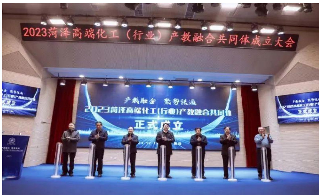
图 46：菏泽高端化工（行业）产教融合共同体成立

学院、菏泽鲁西新区、东明石化集团共同发起，探索提升学生实践技能、深化产教融合新路径，更好服务于黄河流域生态保护和高质量发展国家战略和山东省新旧动能转换、绿色低碳高质量发展发展，推进教育资源与重大产业布局战略匹配，汇聚高校、上下游企业、行业组织、科研机构等 220 余家会员单位联合组建而成。