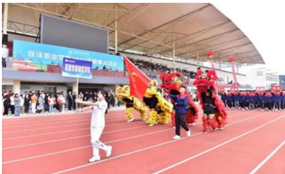
图 30：蒋震智能制造学院“意风舞狮社”社团

栏目，累计上传教学视频及微电影 48 段、短视频 59 段、国学视频 119 集，传统文化经典 101 篇、圣贤人物 39 篇、德音雅乐 48 首、以及传统节日、二十四节气等内容。学生总浏览量累计达到 5 万余人次，点击量累计超过 3 万次。