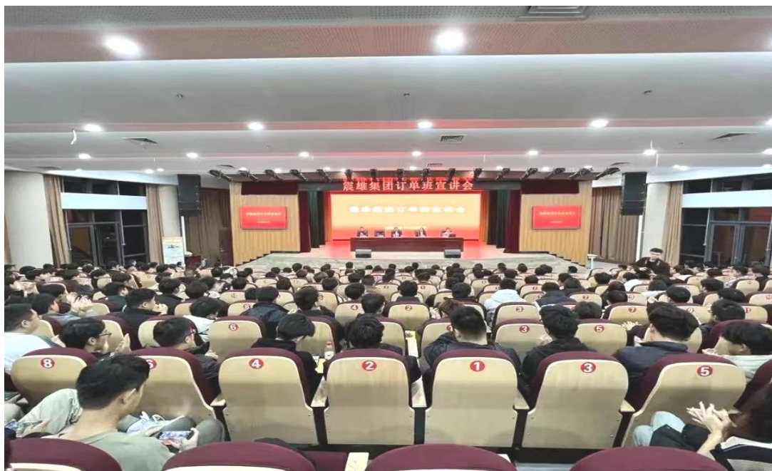
图 44：香港震雄集团订单班宣讲会

关村软件园等教育型企业联合成立了中关村大数据产业学院、华科工业机器人产业学院等，与香港震雄集团共同打造集实训教学、技术转化、仿真生产、技能培训、企业订单人才培养于一体的现代化智能制造产业学院。与京东科技集团共建京东数字商务产业学院，与江苏暖阳半导体科技有限公司共同推进校中厂项目，与江苏无国界航空发展有限公司共建飞机模拟舱实训室。