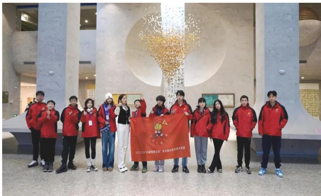
图 41：2023 年“中国寻根之旅”冬令营

访问团、新加坡首都学院访问团、印度尼西亚雅加达国立大学访问团、韩国协成大学访问团、韩国国际文化交流院访问团、韩国中部大学教育学院院长、韩国中部大学观光经营学部学科长、中北非国际教育创新联盟秘书长、泰国素万那普皇家理工大学校长等，为日后进一步推进合作交流打下了坚实的基础。“中国寻根之旅”冬令营营员到菏泽职业学院大学科技园参观交流，20 余名英国华裔青少年在这里探寻文化根源，追溯祖先足迹。