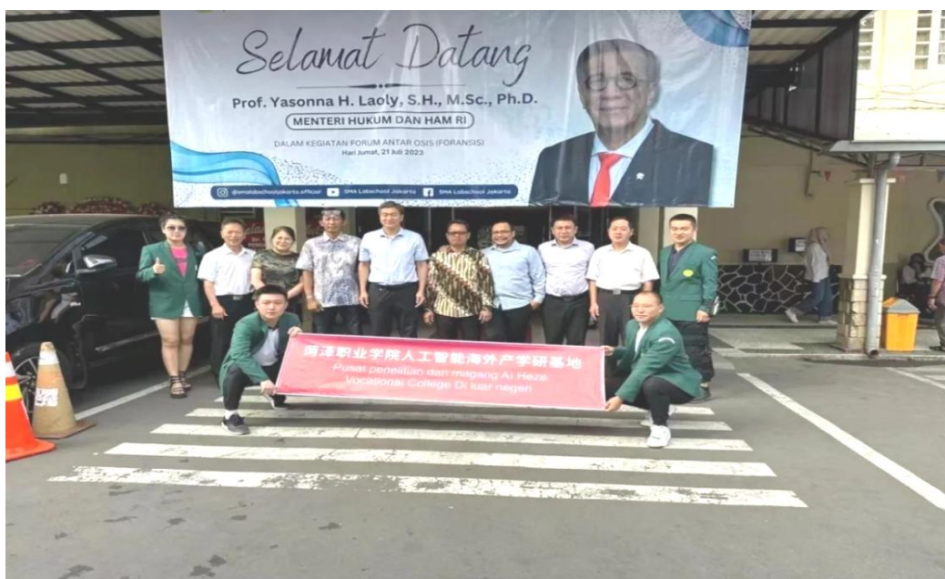
图 38：菏泽职业学院人工智能海外产学研基地

招生 100 人；中韩旅游国际班加大了外方课程和外籍教师课时比例，韩国中部大学 3 名教授到校授课；韩语能力等级考试 topik 海外考点通过初步验收；在韩国中部大学挂牌成立新一代信息技术海外实训基地以及牡丹学院，并建设牡丹园，助推牡丹文化走出去；在印度尼西亚雅加达国立大学成立人工智能海外产学研基地。