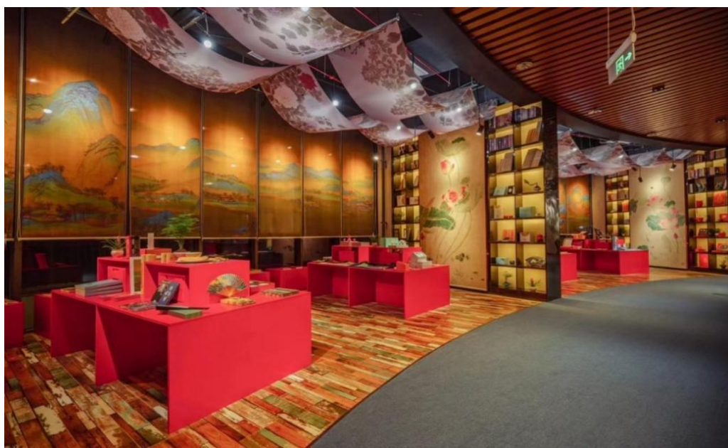
图 45：以“花开盛世”为主题的“悦读故宫”牡丹文化创意展

菏泽职业学院大学科技园专门开辟 5000 平方米的室内公共空间，以弘扬牡丹文化、非遗文化、黄河文化为主旨，建成集万花湖美术馆、非遗文化长廊、手造文化展示区、大师工作室、文创产品区、手造产品直播区于一体的“山东手造·创艺菏泽”展示体验中心，探索大师现场匠心手造、线上线下 AI 实时智能互动体验非遗文化，开展以“花开盛世”为主题的“悦读故宫”牡丹文化创意展，擦亮“中国牡丹之都”的城市品牌，深入挖掘菏泽非遗文化独有特色和传统历史底蕴，多维度打造菏泽城市文化会客厅。