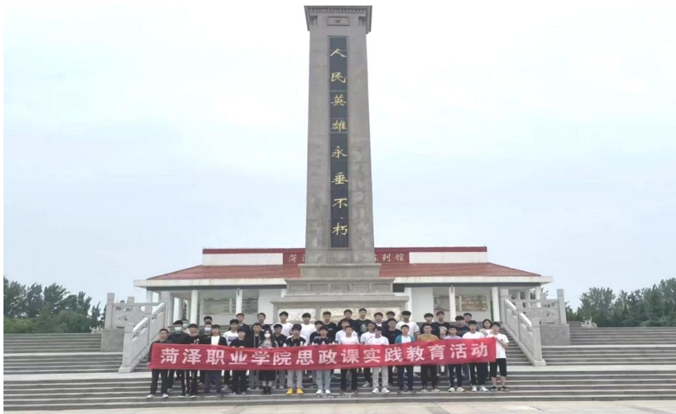
图 1：学生思政课实践教育活动