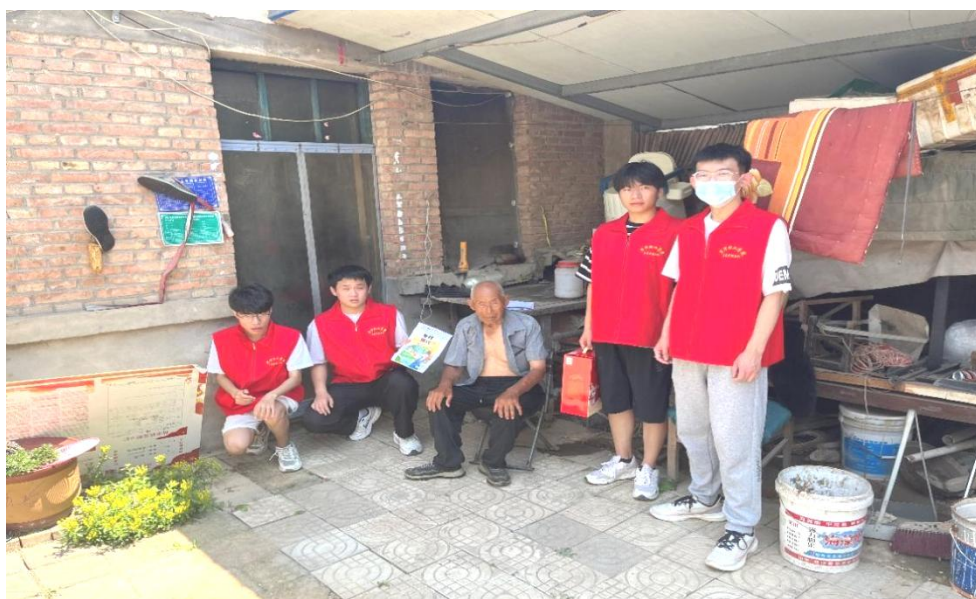
图 10：学生调研农村居民房屋情况

信息工程系“稻香情深”队在菏泽市牡丹区黄堽镇许庄实地调研了当地居民房屋建筑、党政宣传室以及村民活动室的情况，拜访了基层老党员，在与老党员的深入交流中了解目前农村发展情况，了解当地农村的经济状况、房屋老旧失修等方面问题，团队成员经过研究调查认为可以发展当地农业，给农民带来一份可观的收入，村里可以定期调查老旧房屋问题，如果出现独居老人住危房情况，可以帮助其解决。并且在考察交流过程中，团队听取了老党员及村民关于乡村振兴的意见和建议，深入了解了农村现状以及农民发展需求，为此制定了切实可行的方案，为农村发展奉献一份力量。