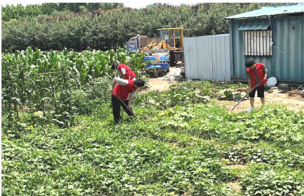
图 11：学生帮助村民分担农活

旱浇、涝排、交通等多项条件，进行合理规划，配型种植，发展出花卉区、蔬菜区、高效农业示范区、养殖区、农业观光旅游区和商业营销网络的“五区一网”现代农业种植模式。通过深入调研，了解当地农村的农业生产模式、支柱性产业等方面现况，团队讨论研究认为，应大力拓展农产品、花卉产品销售渠道，通过对目前市场的分析，制定了农产品的宣传推广策略，帮助他们提高农产品的品质和市场竞争力。这次活动为当地村民提供了一份可切实参考的发展方案，也让参与的学生获得了许多宝贵的经验和技能。