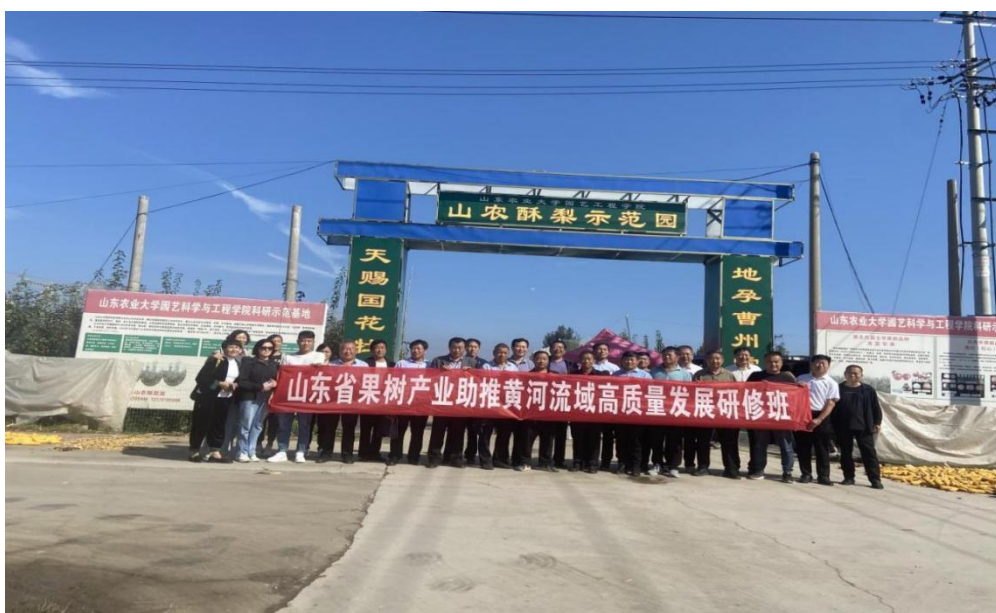
图 26：果树产业助推黄河流域高质量发展研修班教学观摩

菏泽职业学院承办山东省果树产业助推黄河流域高质量发展高级研修班和山东省新媒体环境下农产品营销模式优化升级高级研修班，参训学员主要有技术推广人员、果树家庭农场、第一书记、农业合作社负责人等共计 90 人，培训采取专家授课、学员交流研讨、实地教学观摩等多种形式直观地进行技术学习交流，贯彻落实乡村振兴战略，推进菏泽果树产业高质量发展，进一步推动了黄河流域生态保护和高质量发展，践行“两山”理念。