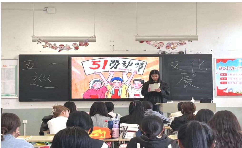
图 8：劳动教育文化巡展活动学生发言

引领作用，传承优良品格，学校学前教育系紧扣“五一劳动节”时间节点，开展“五一劳动教育文化巡展”主题活动。在活动开展过程中，各班级通过开展主题班会、班级主题环境创设、班级主题契合的手工作品制作展示、外出实践等多种形式积极参与，最终呈现出独立的、个性鲜明的班级主题文化，每个班级 10-15 分钟时间来展示自己的班级主题，并由教师进入各班教室进行评审和打分。此次活动各班级参与热情高涨，实现了学前教育系 2021 级和 2022 级学生的齐参与、全覆盖。“五一劳动节文化巡展”活动，用全新的形式让同学们通过不同的“劳动”体验到了劳动的意义，也感受到劳动人民的艰辛，培养学生们服务社会、服务他人的服务意识和奉献情怀，让劳动最光荣、劳动最伟大的精神深入人心，真正向成为合格的社会主义建设者和接班人大踏步前进！