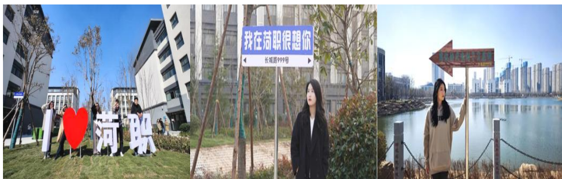
图 7：校园文化打卡地

文化育人。一是丰富校园文化活动。开展“笔”墨书香·厚“记”薄发最美笔记征集活动、“让阅读成为习惯 让思考伴随人生”读书分享会、校园音乐节、趣味运动会、摄影、征文、知识竞赛、观影活动、演讲比赛、辩论赛等丰富多彩的校园文化活动，引导广大同学弘扬家国情怀、传播先进文化、促进社会发展，着力提升校园文化建设内涵，营造温馨和谐的校园氛围。二是打造校园文化打卡地。陆续在校园打造了“I LOVE 荷职”“想你的风吹到了万花湖”等同学们喜闻乐见的校园文化打卡地，同时将校风校训也打造成了校园文化打卡地，更好地发挥文化育人效果。三是打造公寓文化。充分利用公寓这个学生学习生活的重要阵地，大力开展公寓文化建设。将学生公寓安全编成顺口溜，在公寓门口屏幕常态化播放；在各公寓大厅，打造思政教育宣传阵地；在公寓走廊，制作公寓文化墙，传播干净整洁和谐和睦的公寓文化。定期开展文明宿舍评选和警示教育活动，引导学生改掉陋习，拥抱文明。