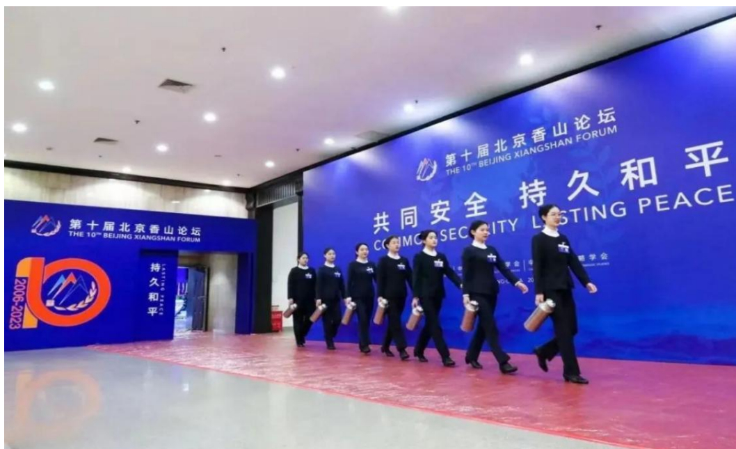
图 43：菏泽学生参与“香山论坛”会务服务保障

组织不同专业学生到企业进行岗位实习实践，将所学理论知识运用于现实生产，加深了对相关专业知识内容的理解，锤炼了岗位所需的实践技能。菏泽职业学院旅游管理 21 级 752 名学生在工学结合期间，分布在不同的企业行业，参与实践学习，分别服务于旅游行业、酒店行业、文艺行业、舞蹈行业等行业类别，并在国家、国际大型会议上承担会议服务和保障工作，获得行业企业一致好评。