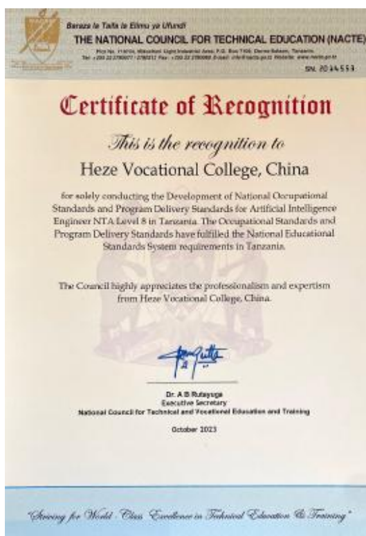
图 40. 国家职业标准认证证书

开发了坦桑尼亚人工智能工程师NTA8级国家职业标准及配套的专业教学标准。通过借鉴我国职业技能标准，充分调研坦桑尼亚行业岗位标准与职业教育现状，多次召开线上、线下推进会，与坦方及国内专家进行沟通论证，最终开发出坦桑尼亚官方认可的国家职业标准及配套的专业教学标准，用以指导坦桑尼亚国家职业院校开展人才培养工作。此次坦桑尼亚人工智能技术工程师 NTA8 级职业标准及专业教学标准的开发，充分发挥中国职业教育的优势和特点，帮助坦桑尼亚引进中国职业教育资源，健全和完善坦桑尼亚人工智能领域职业标准和职业教育体系。