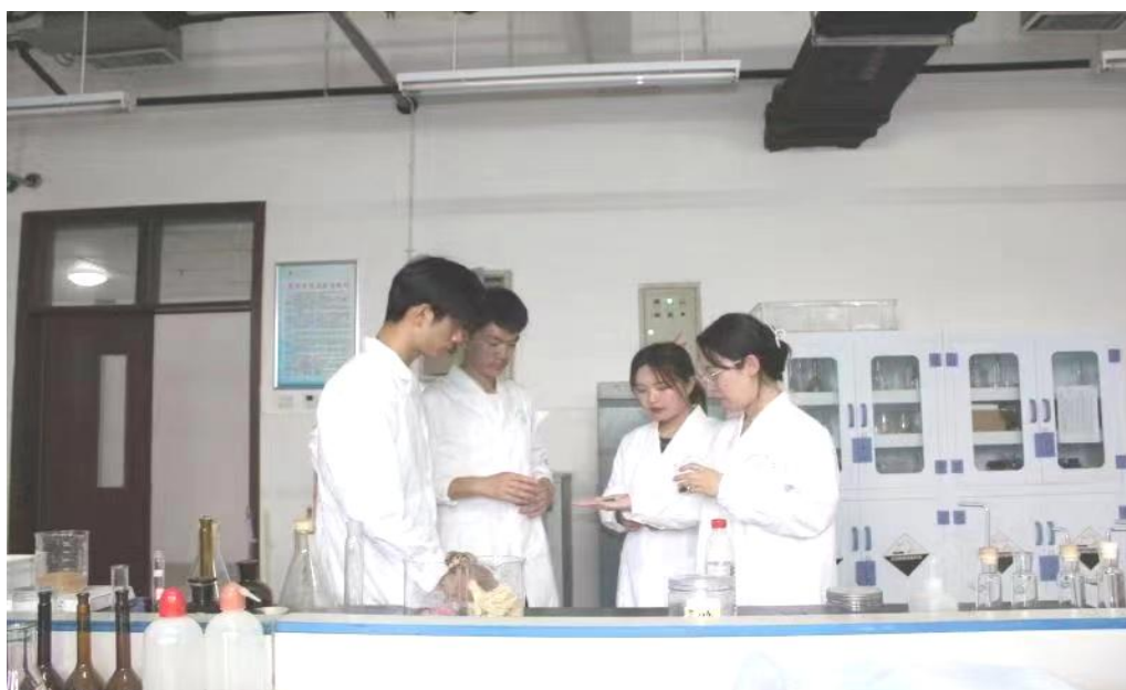
图 17：创业学生在学校牡丹研究院实验室进行新品种培育及出油率检测

额已达 1902.8 万余元。选育出高出油率种苗，市场价 50% 为农民提供优质种苗，给予种植技术指导并签订种植协议，保价收购牡丹籽，保障农民利益。目前已在杨庙村等 21 个村庄规划 5000 余亩油用牡丹示范区，提供种苗 3000 万株，培训人次 2000 余人，带动 1400 余名农民就业，农户年均增收 5000 余元。