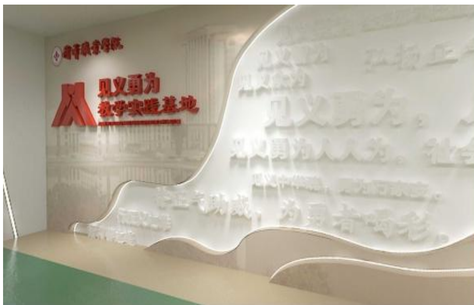
图 3：菏泽职业学院见义勇为实践教学基地

为贯彻落实党的二十大精神和习近平总书记关于加强见义勇为工作的重要指示精神，进一步弘扬社会正气，倡导见义勇为行为，推进平安校园建设，打造菏泽“仁义之乡”城市名片，营造学习英雄、争做英雄的良好社会氛围，菏泽职业学院正积极推进面向全社会开放的见义勇为实践教学基地建设。见义勇为实践教学基地以教育性、启发性、互动性为原则，以多媒体展示、实物观摩、互动体验为方式，重点打造见义勇为的历史沿革、见义勇为的精神内涵和价值、见义勇为的种类和典型案例、见义勇为的现实应用和挑战四大主题板块，以提高公众对见义勇为行为的认知和理解，弘扬社会主义核心价值观。