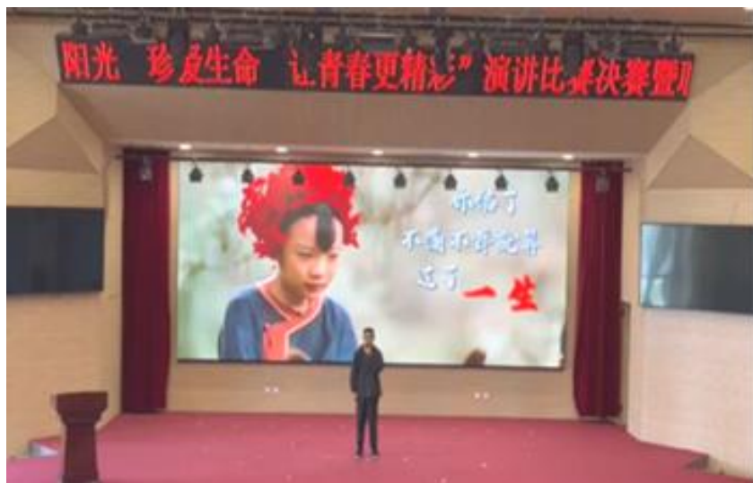
图 4：学生心理健康演讲比赛

法治教育。 加强《思想道德与法治》公共基础课程建设，开设专业法律相关课程；组织开展“宪法卫士”活动，参与人数 9966 人，参与率达 97.9%；开展宪法宣传周系列活动，包括宪法宣誓、朗诵、观看“宪法晨读”直播、学唱宪法歌曲等；与菏泽市政法委、法院、监狱等相关部门交流合作，创新法治宣传教育模式，举办法治专题讲座，增强学生的法律意识和法治素养。