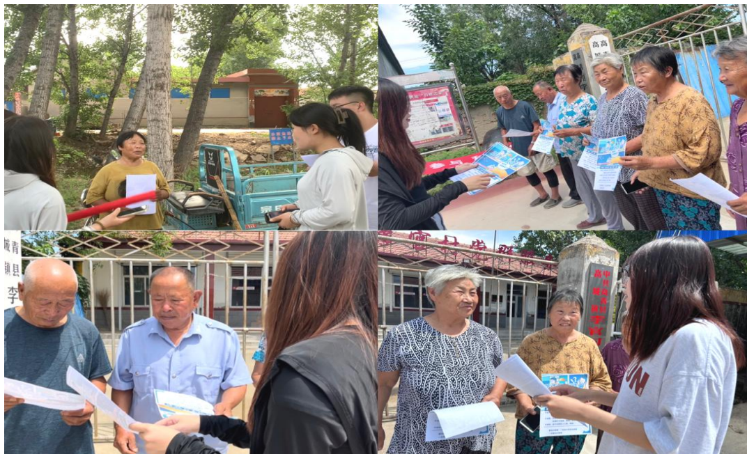
图 12：学生向村民发放防诈骗宣传手册

旅游管理系舞蹈表演班“三下乡”小分队前往菏泽市牡丹街道办事处傲阳社区开展法律宣讲，学生细心准备了社区居民所关注的热点问题，并努力将法典中的问题与生动的案例结合起来，以达到良好宣传效果，并且分发法律宣传手册，与当地村民围绕知法、学法、守法、懂法、用法等问题进行了专题交谈，并对村民们提出了法律问题进行解答，有效提高了当地居民的守法用法意识，为依法治村提供了坚实的理论保障。