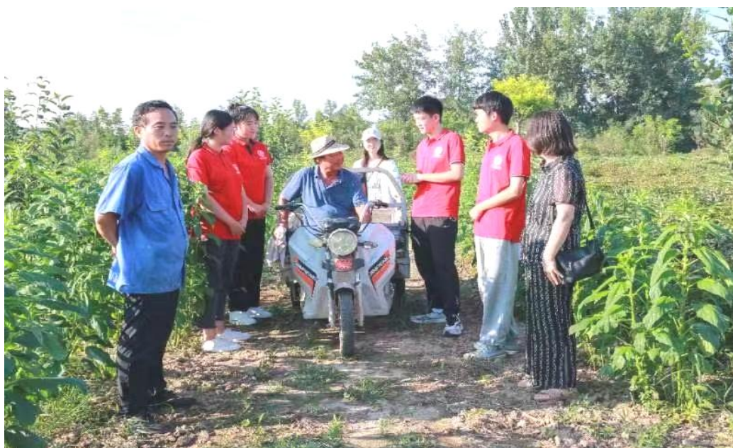
图 18：创业团队与老花农进行种植技术交流