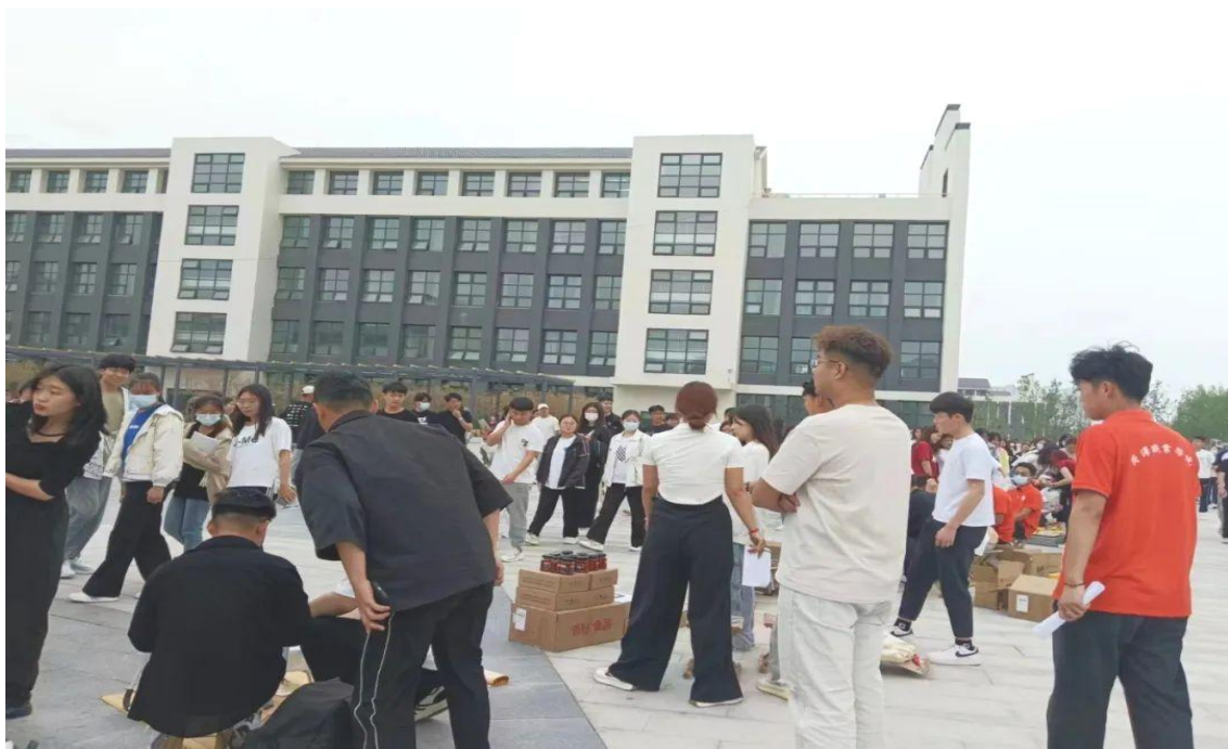
图 19：学校热闹的集市活动现场

为积极实践“大众创业、万众创新”的精神要义，持续深化大学生创新创业教育，以创新组织形式、拓展实践路径、营造青春氛围为着力点，大力开展主题鲜明、成果丰富的大学生创新创业活动，增强青年实践能力，5月10日下午，菏泽职业学院创新创业协会于工匠广场举办大学生创意集市活动。活动现场人来人往，人声鼎沸，热火朝天，摊主们的热情吆喝声和来往顾客的砍价声汇成一片。为闲置物品、创意新物、精致美观的小物件找到了他们的归所。此次活动将创意与市集相结合，不仅能提高学生创新创业意识和动手能力，激发创业热情，让学生将创意转化为实物，而且有利于进一步构建校园文化产业市场，营造浓厚的大学生创新创业文化氛围。