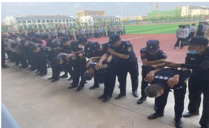
图 22： 安保培训体能训练现场