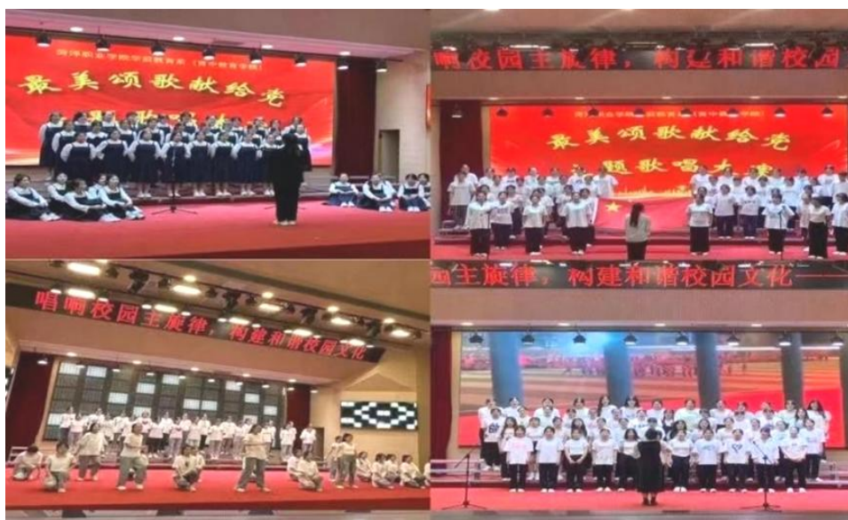
图 6：“红旗飘飘，励志传承”红色经典朗读比赛

组织育人。 充分发挥党组织、团组织、学生会组织的育人作用，立足立德树人根本任务，学校党委出台《中共菏泽职业学院委员会开展“三立三做”党建品牌创建专项行动实施方案》，开展“三立三做”党建品牌创建专项行动，做实新时代为党育人、为国育才工作；各级团组织开展“2023 年全民国家安全教育日”、“点亮青春理想，争做时代新人”五四青年节等主题团日活动 18 次；以“学习二十大，永远跟党走，奋进新征程”、“党的二十大战略部署”、“学习习近平新时代中国特色社会主义思想”等主题团课活动 12 次；开展“青春心向党，奋进新征程”思政宣讲，将党的科学理论用青年化的语言和方式进行阐释，参与人次约 6000 人。校团委学生会开展以“思想旗帜”、“坚强核心”、“强国复兴”、“挺膺担当”为专题的主题教育，感悟新时代党和国家事业取得的历史性成就、发生的历史性变革，进一步提高青年思想觉悟。